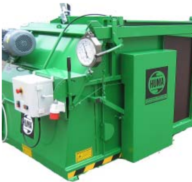
Fodervagnen på bilderna är extrautrustad

Med HUMA rälsgående rivarvagn så eliminerar ni ett av dom tyngsta arbetena i en ladugård. Vagnens enkla handhavande och att den är rälsburen gör att ni snabbt gör en utfodring och att även ny personal snabbt lär sig att utfodra.