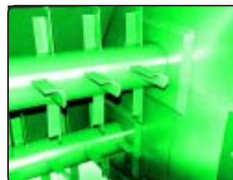
Gaveltätningar för valsar